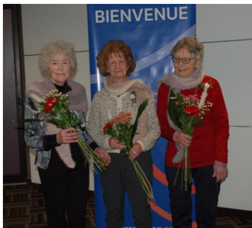
Hommages à nos sages