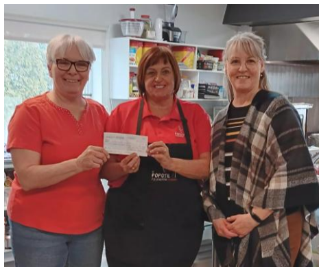
Dons à la popote mobile